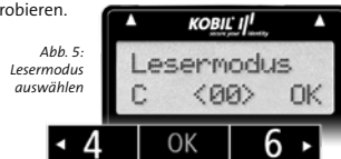
Abb. 5: Lesermodus auswählen

In der Grundeinstellung ist Lesermodus <00> ausgewählt (Abb. 5). Falls Sie Probleme bei der optischen Übertragung haben, können Sie alternativ auch die Lesermodi 1 oder 2 ausprobieren.