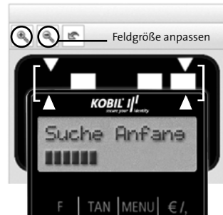
Abb. 4: optische Übertragung