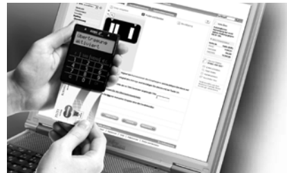
Abb. 3: Anwendung