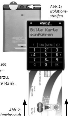
Abb. 1: Isolationsstreifen