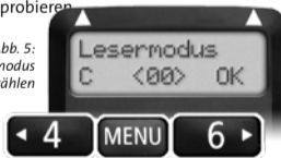
Abb. 5: Lesermodus auswählen

Wählen Sie den Lesermodus mit den „Pfeil links“ und „Pfeil rechts“-Tasten aus und bestätigen Sie ihn mit der Bestätigungs-Taste „OK“.